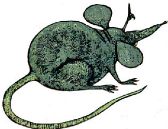
LA SOURIS la souris la souris