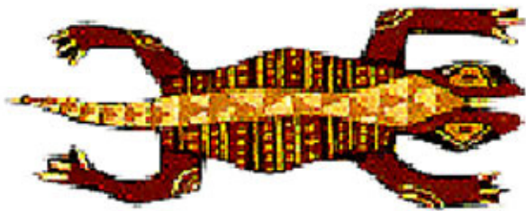
UN LÉZARD un lézard un lézard