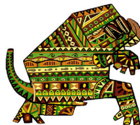
TRIMOBE, LE MONSTRE Trimobe, le monstre Crimobe, le monstre