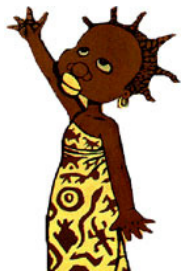
RAFARA Rafara Rafara