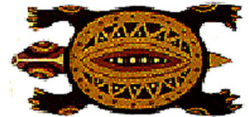
UNE TORTUE une tortue une tortue