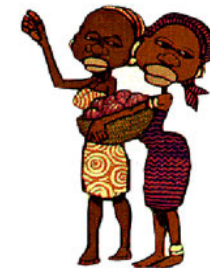
SES SOEURS ses sœurs ses sœurs