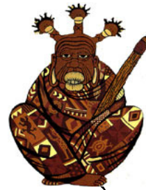
SON PÈRE son père son père