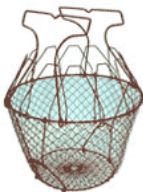
un panier à salade