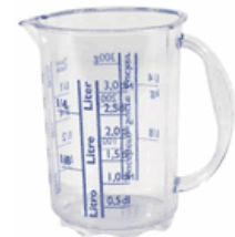
un verre doseur