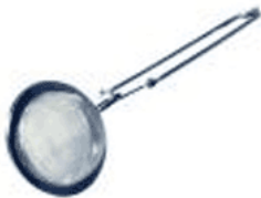
une boule à thé