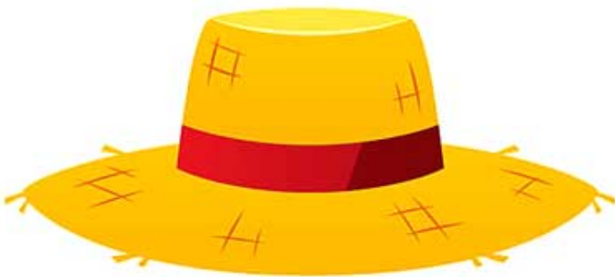
UN CHAPEAU / un chapeau