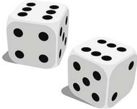
LES DÉs / les dés