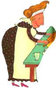
LA REINE DES GÂTEAUX la reine des gâteaux