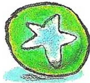
UN BALLON / un ballon