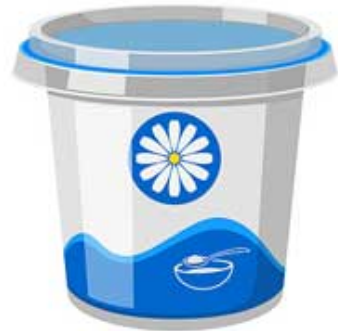
LA CRÈME FRAÎCHE la crème fraîche