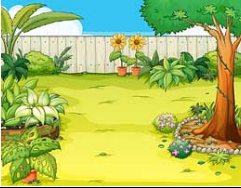
UN JARDIN / un jardin