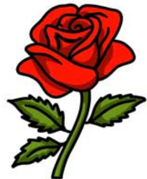
UNE ROSE / une rose