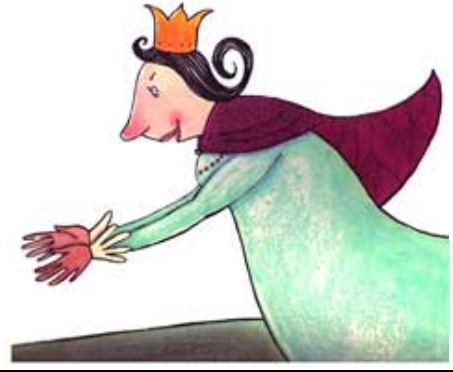
LA REINE / la reine