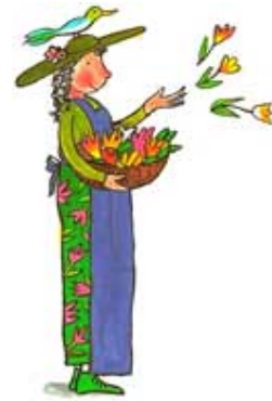
LA REINE DES FLEURS la reine des fleurs