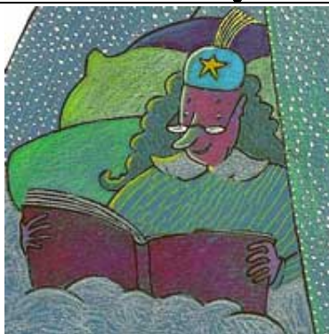
LA REINE DE LA NUIT la reine de la nuit