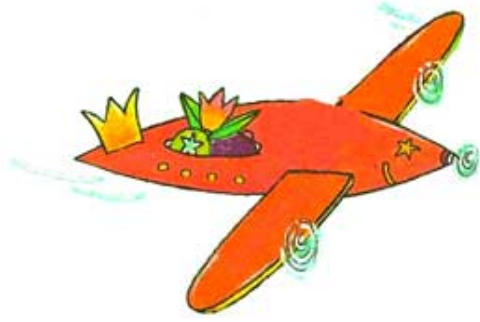
UN AVION / un avion