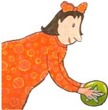
LA REINE DES JOUETS la reine des jouets