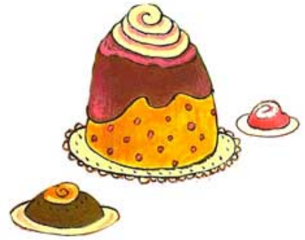
DES GÂTEAUX / des gâteaux