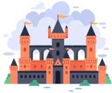
UN PALAIS / un palais