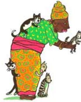
LA REINE DES CHATS la reine des chats