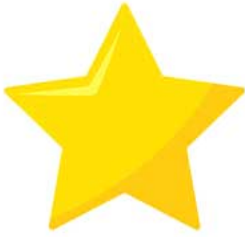
UNE ÉTOILE / une étoile