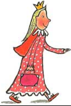
LA PRINCESSE / la princesse