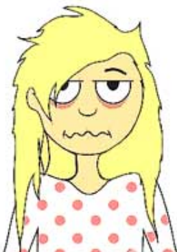
ÉPUISÉE / épuisée