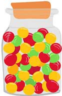
UNE BONBONNIÈRE une bonbonnière