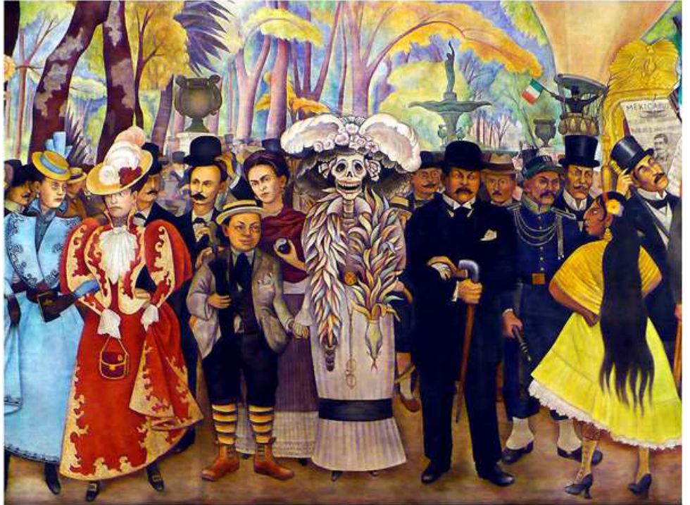
"Rêve d'un dimanche après-midi au parc Alameda" - 1948

Diego Rivera est un peintre mexicain connu pour ses fresques murales.