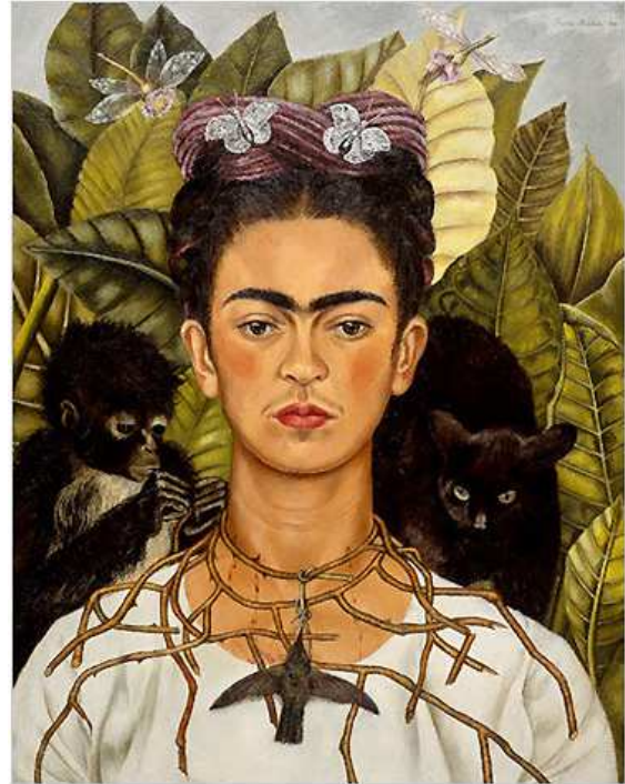
" Autoportrait au collier d'épines" - 1940

Frida Kahlo est née au Mexique. Dans son enfance elle est atteinte d'une poliomyélite qui lui laissera la jambe droite déformée. Elle commence de brillantes études d'art. A 18 ans elle est victime d'un accident de tramway qui lui brisera la colonne vertébrale. Alitée, elle fait placer un miroir au-dessus de son lit et commence une série d'autoportraits qui sera sa façon à elle d'exprimer sa douleur et de raconter sa vie. Ses peintures sont très colorées. On y retrouve beaucoup d'éléments de sa culture mexicaine. Elle rencontre Diego Rivera en 1928. Elle a eu comme animal de compagnie un singe et des chiens aztèques du nom de Xoloitzcuintle.