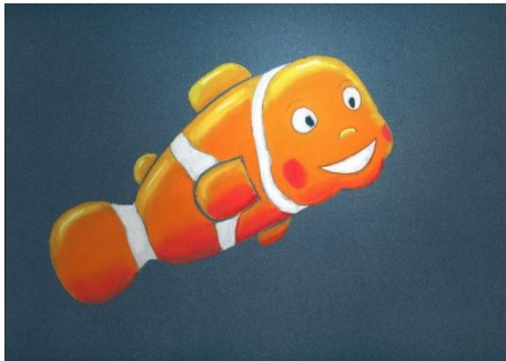
le poisson ?