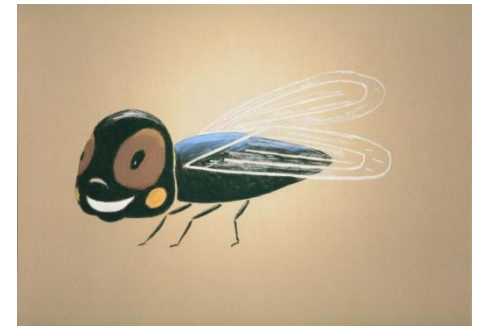
la mouche ?