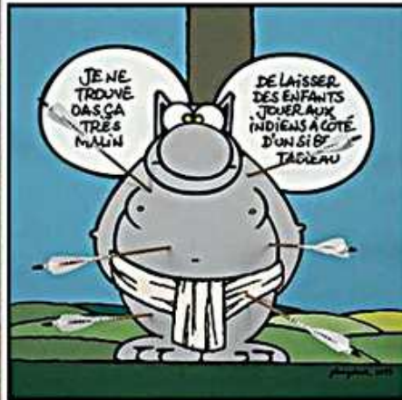
Le Prométhée de Titien - 2013 - Artwork sur toile en fibres en bois et papier, 100 x 100 cm