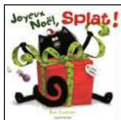
Joyeux Noël, Splat !

Site de l'auteur : http://www.robscotton.com/ (on peut y trouver également des illustrations)