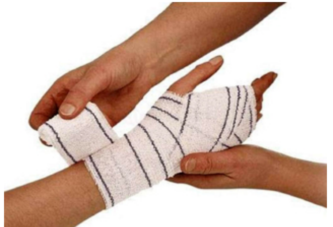
BANDAGE / bandage