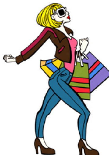
SE PAVANER / se pavaner