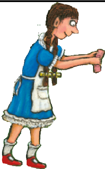
LA PETITE FILLE