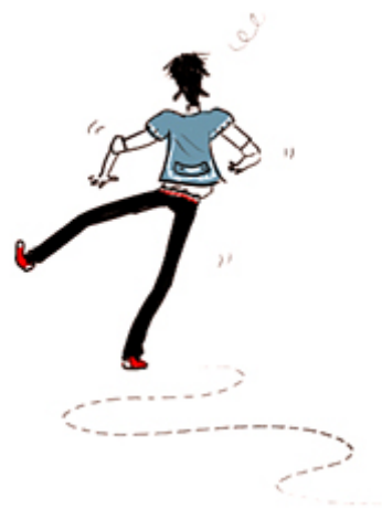
ZIGZAGUER / zigzaguer