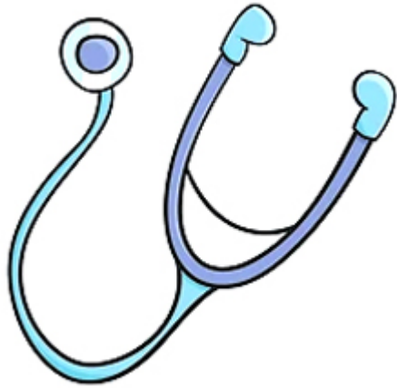
STETHOSCOPE / stéthoscope