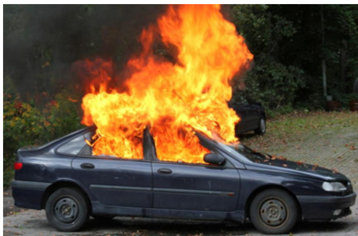
S'ENFLAMMER / s'enflammer