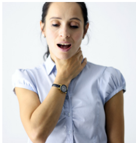
SE CASSER LA VOIX