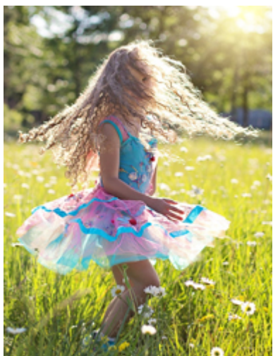
TOURBILLONNER / VIREVOLTER