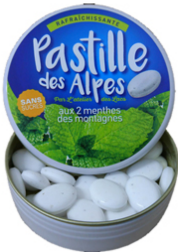
PASTILLES / pastilles