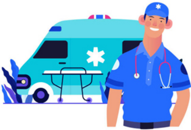
AMBULANCIER / ambulancier