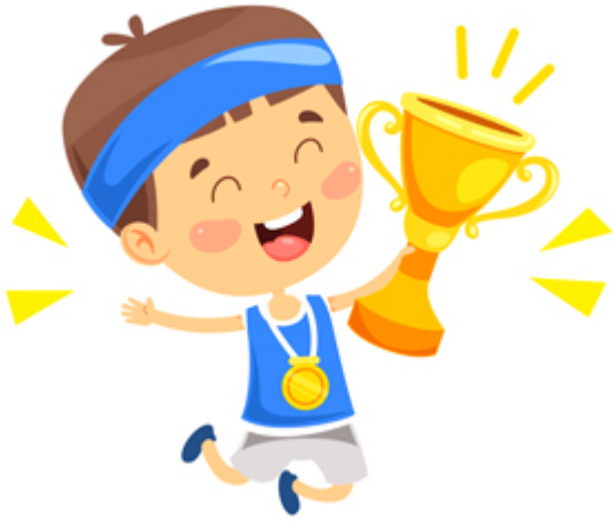
CHAMPION / champion