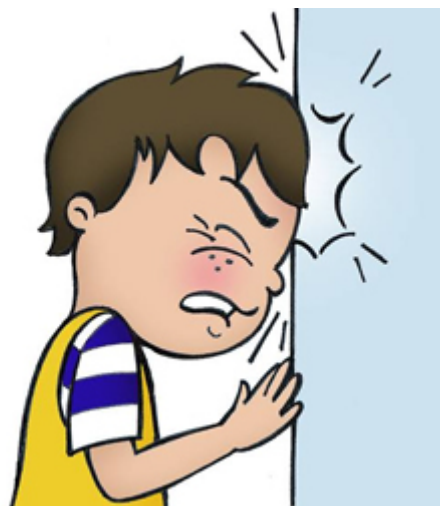
SE COGNER / se cogner