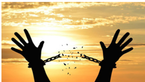
DELIVRER / délivrer