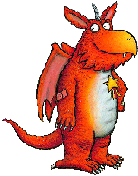
ZÉBULON / zébulon