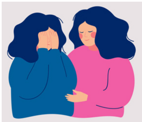
CONSOLER / consoler