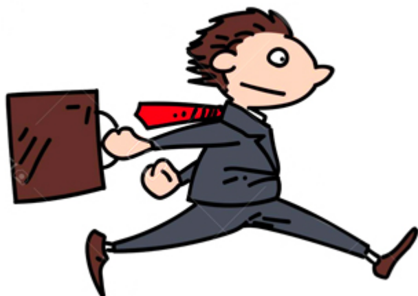
SE PRECIPITER / se précipiter