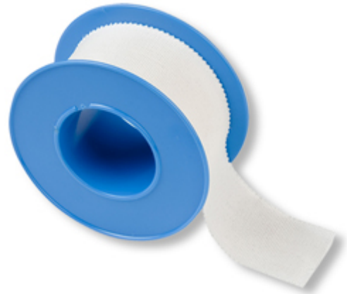
SPARADRAP / sparadrap