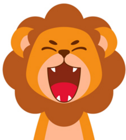
RUGIR / rugir