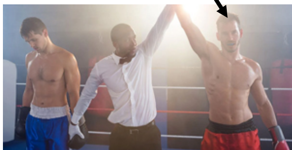
REMPORTER LE COMBAT