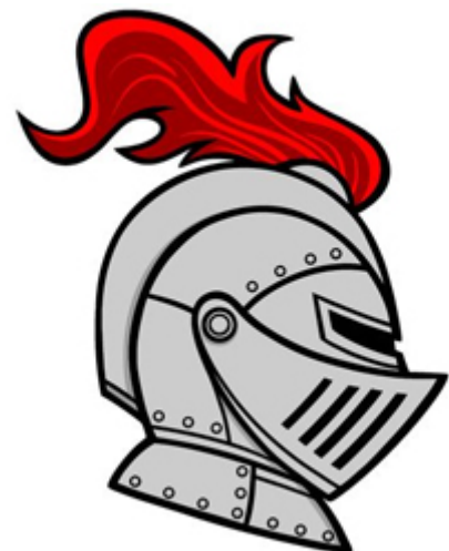
HEAUME / heaume