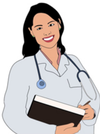
MEDECIN / médecin