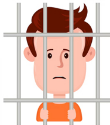
CAPTURER / capturer