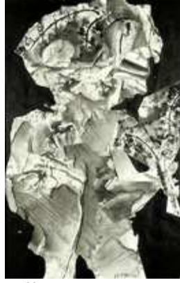
L'offreur de bouquet