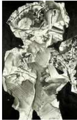
L'offreur de bouquet