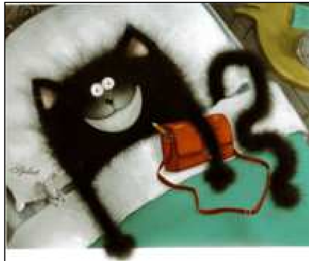
LA JOIE (le plaisir)

Splat est content parce qu'il fait un sourire , sa queue se tortille . Il a gardé son sac d'école pour dormir. L'émotion c'est le contentement .