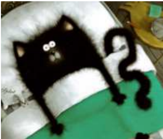
LA PEUR (l'inquiétude)

Les émotions PEUR/JOIE à partir de l'observation des illustrations de Splat au début et à la fin de l'album "Splat le chat" de Rob Scotton - Nathan