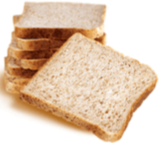
Pain de mie