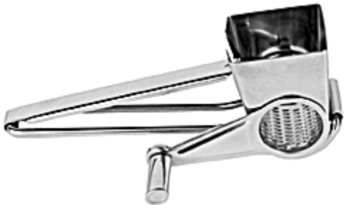
Râpe à fromage moulinette