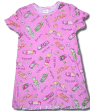
une chemise de nuit UNE CHEMISE DE NUIT une chemise de nuit