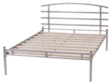
un sommier UN SOMMIER un sommier