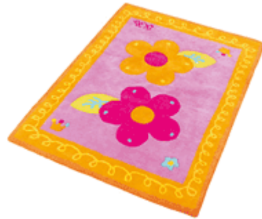
un tapis UN TAPIS un tapis