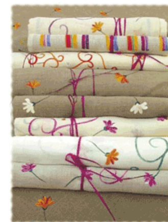
des draps DES DRAPS des draps