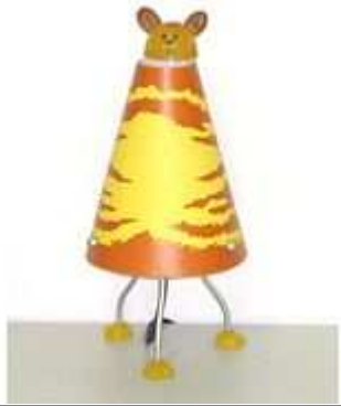
une lampe de chevet UNE LAMPE DE CHEVET une lampe de chevet