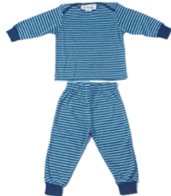
un pyjama UN PYJAMA un pyjama