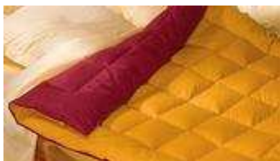
un édredon UN EDREDON un édredon