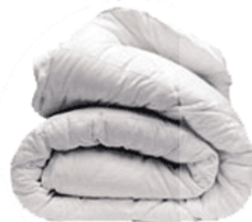
une couette UNE COUETTE une couette