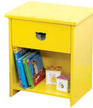
une table de nuit UNE TABLE DE NUIT une table de nuit