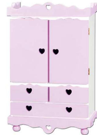
une armoire UNE ARMOIRE une armoire