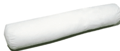
un traversin UN TRAVERSIN un traversin