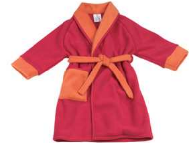
une robe de chambre UNE ROBE DE CHAMBRE une robe de chambre