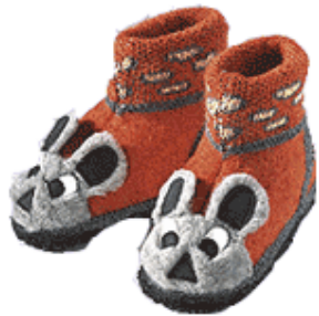
des chaussons DES CHAUSSONS des chaussons