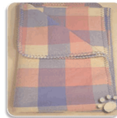
une couverture UNE COUVERTURE une couverture