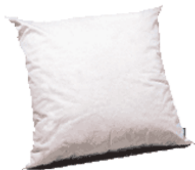
un oreiller UN OREILLER un oreiller