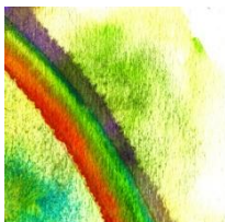
a rain bow