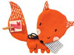
RENARD renard renard