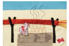
queue queue queue