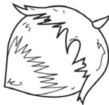
NOISETTE noisette noisette