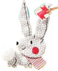
LAPIN lapin lapin