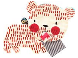
OURS ours ours