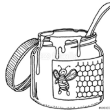
MIEL miel miel