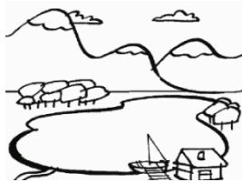
LAC lac lac