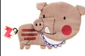
SANGLIER sanglier sanglier