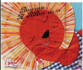
LION lion lion