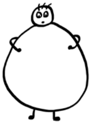
GROS gros gros