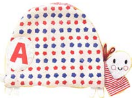
TORTUE tortue tortue