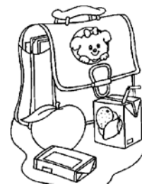
GOÛTER goûter goûter