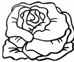
SALADE salade salade