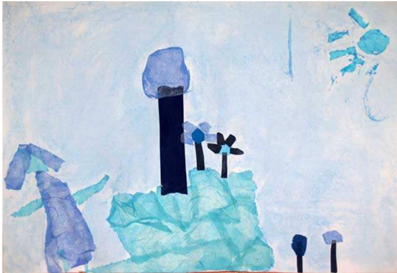
Une fille qui regarde l'arbre et les fleurs bleus sur la colline. (Viviane)