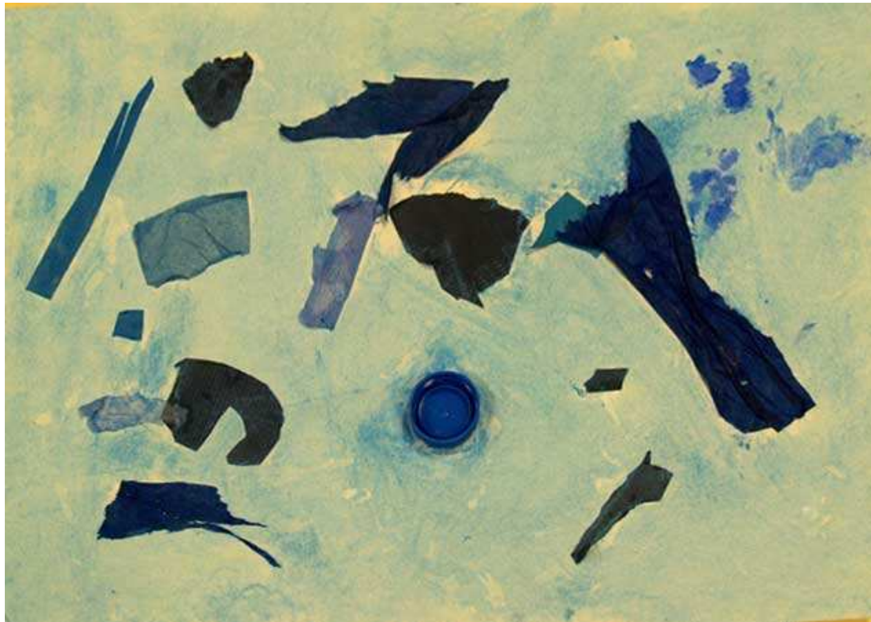
La fusée bleue de papa part de la montagne bleue. (Jeanne R.)