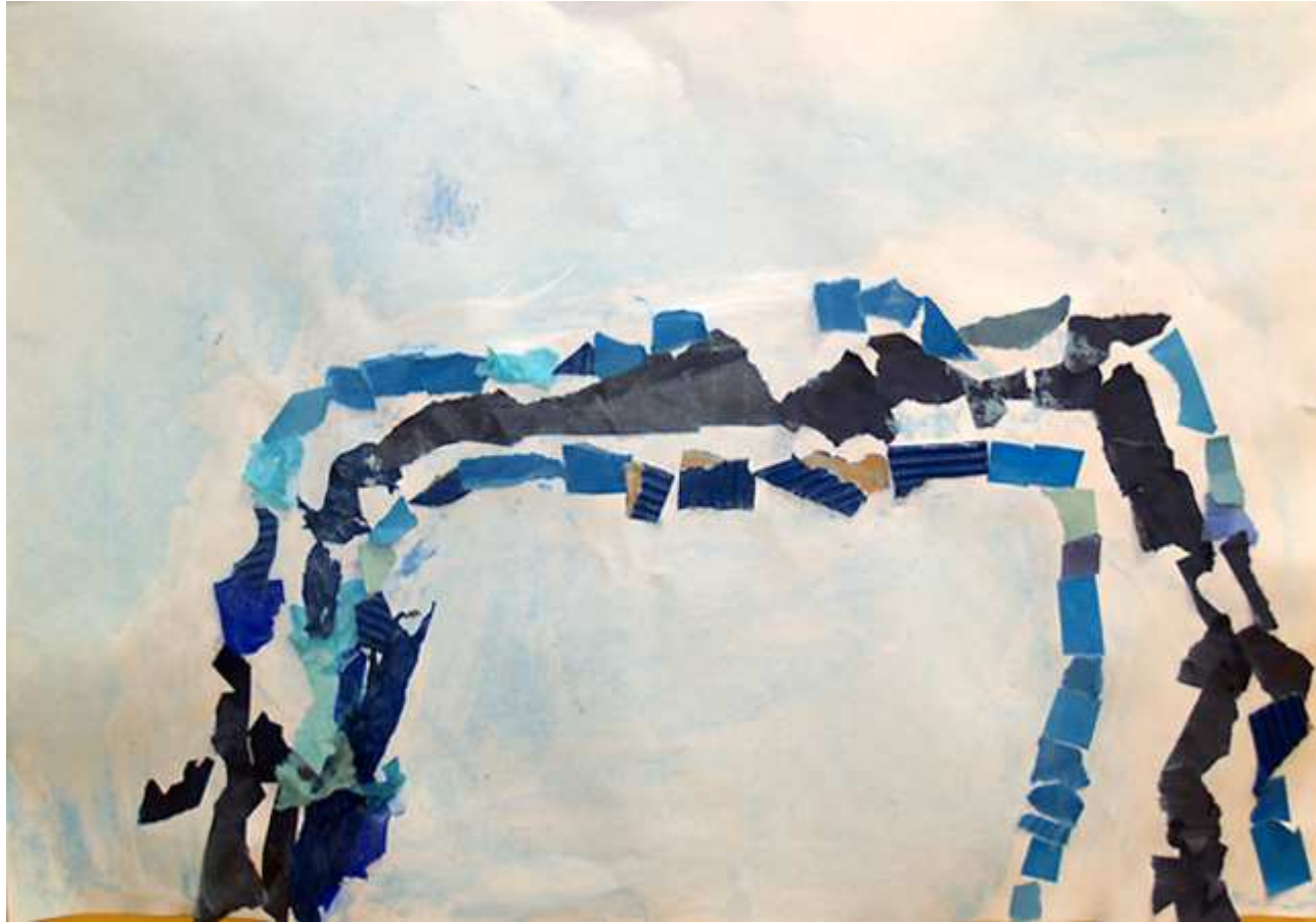
Un arc-en-ciel bleu. (Inès)