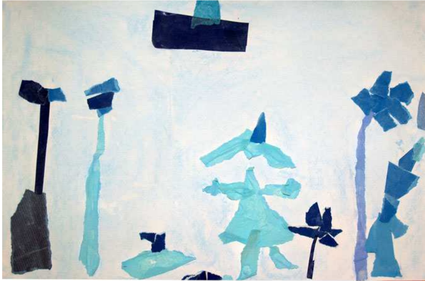
Dans ce monde, les arbres sont bleus, il y a une fleur bleue, un bateau sur l'eau et au loin un phare bleu. (Camille)