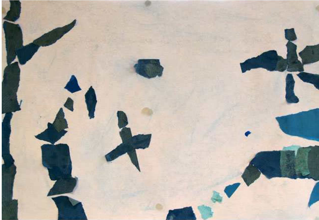
Un petit homme descend de la montagne bleue et prend le chemin pour rentrer à sa maison dont la cheminée fume, un oiseau bleu l'accompagne. (Matéo)