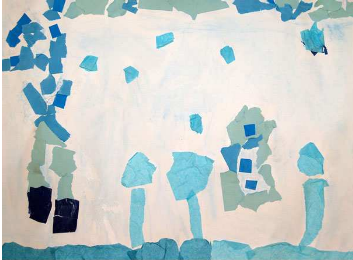
Une femme verse le pot de peinture bleue sur un homme qui lève les bras à côté de la maison bleue du magicien entre les arbres bleus (Jeanne L.)