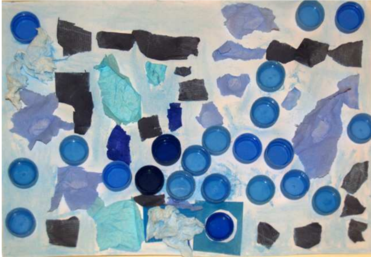
La pluie bleue et le soleil bleu (Matthieu)