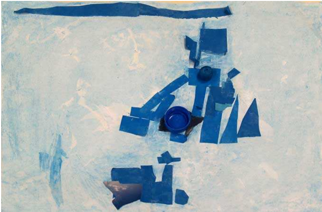
Une structure de jeux avec un tunnel et un toboggan bleus. (Eliott)