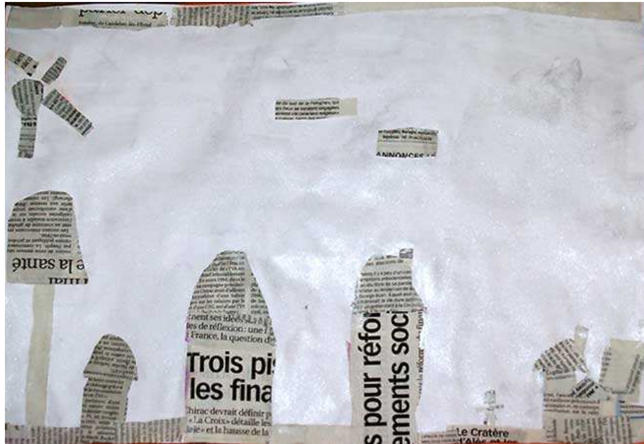
Un village. (Viviane)