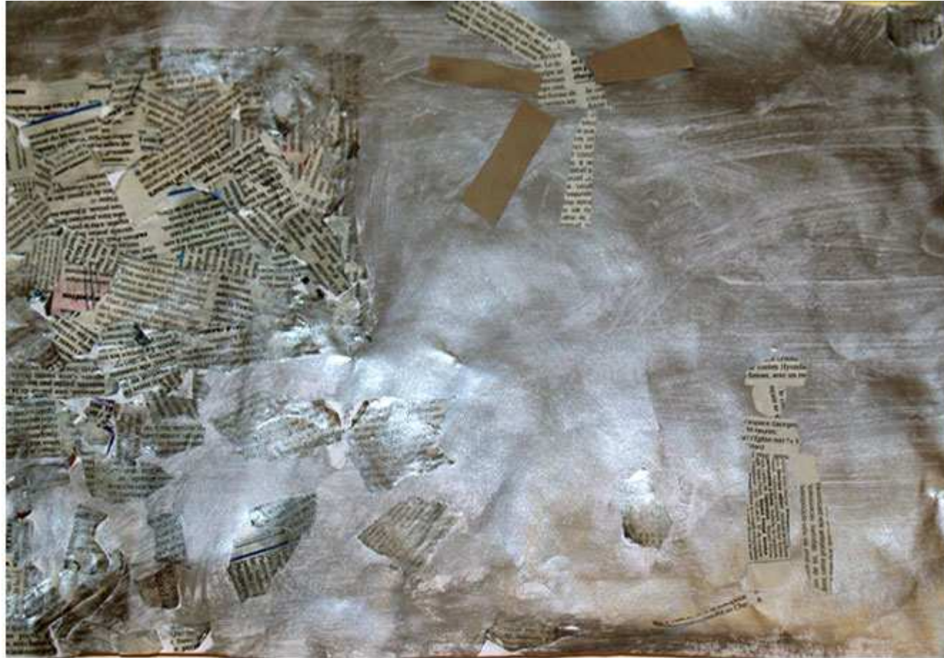
Il y a un orage, la maison s'écroule, le petit enfant regarde et il a peur (Eugénie)