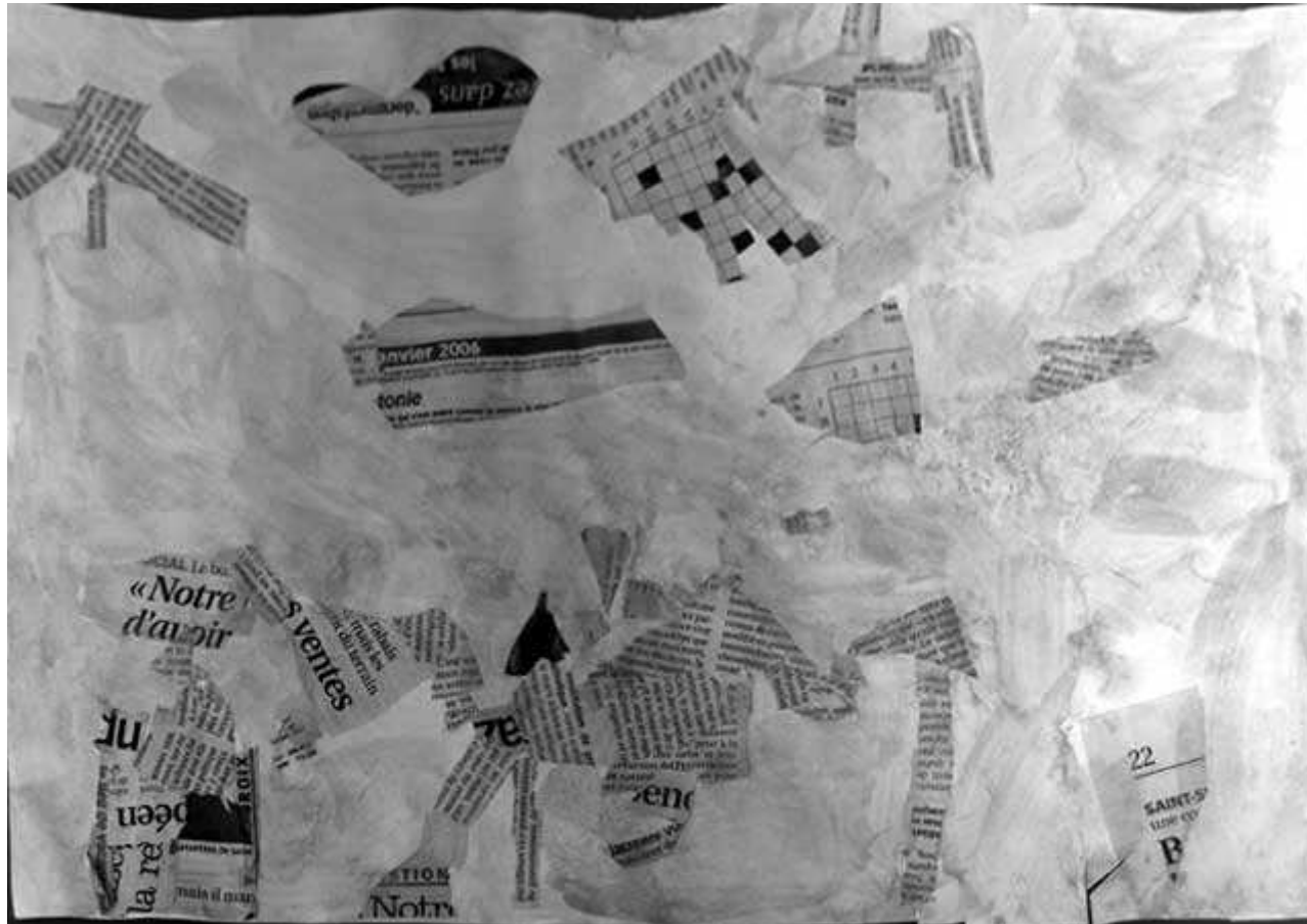
Un homme prend le passage secret de l'église. (Eliott)