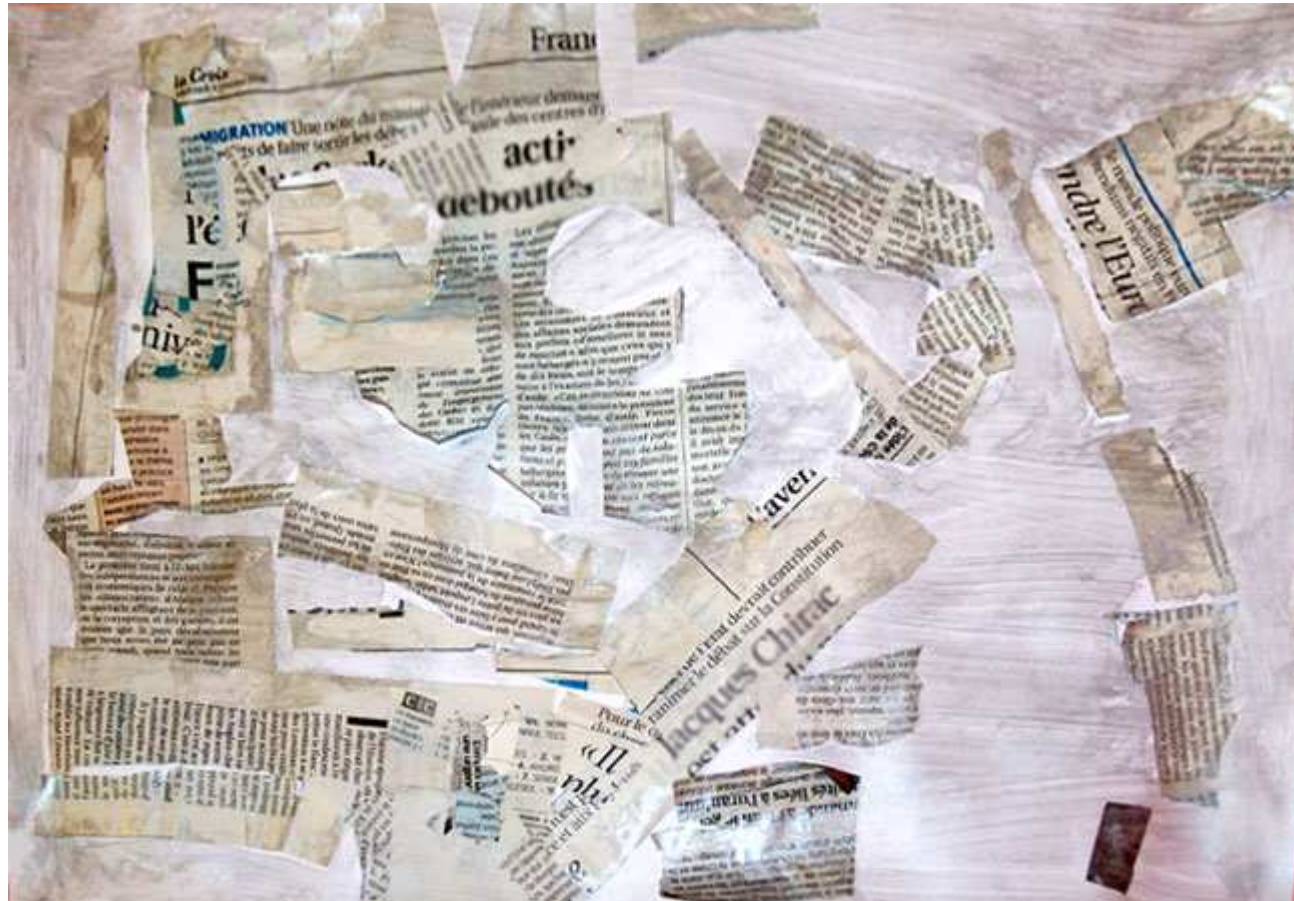
La maison du magicien. (Romain)