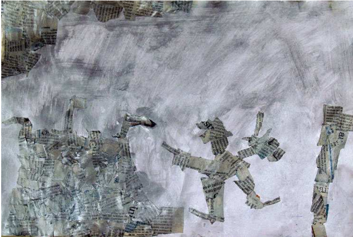
Le magicien avec son pinceau est à côté du château. (Maxime D.)