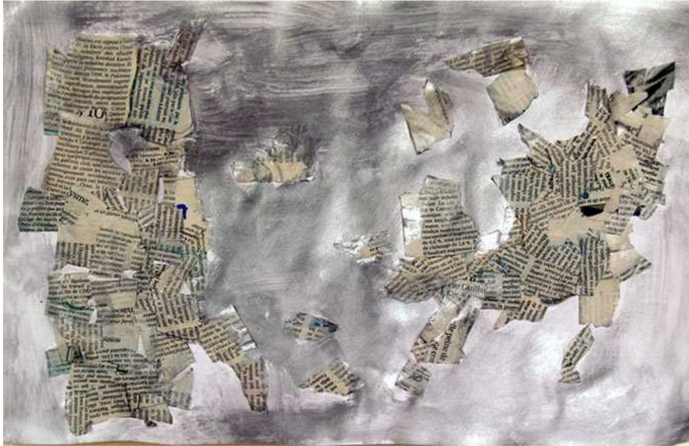
Un homme qui a perdu tous ses livres en courant parce qu'il était en retard au travail (Dorian)