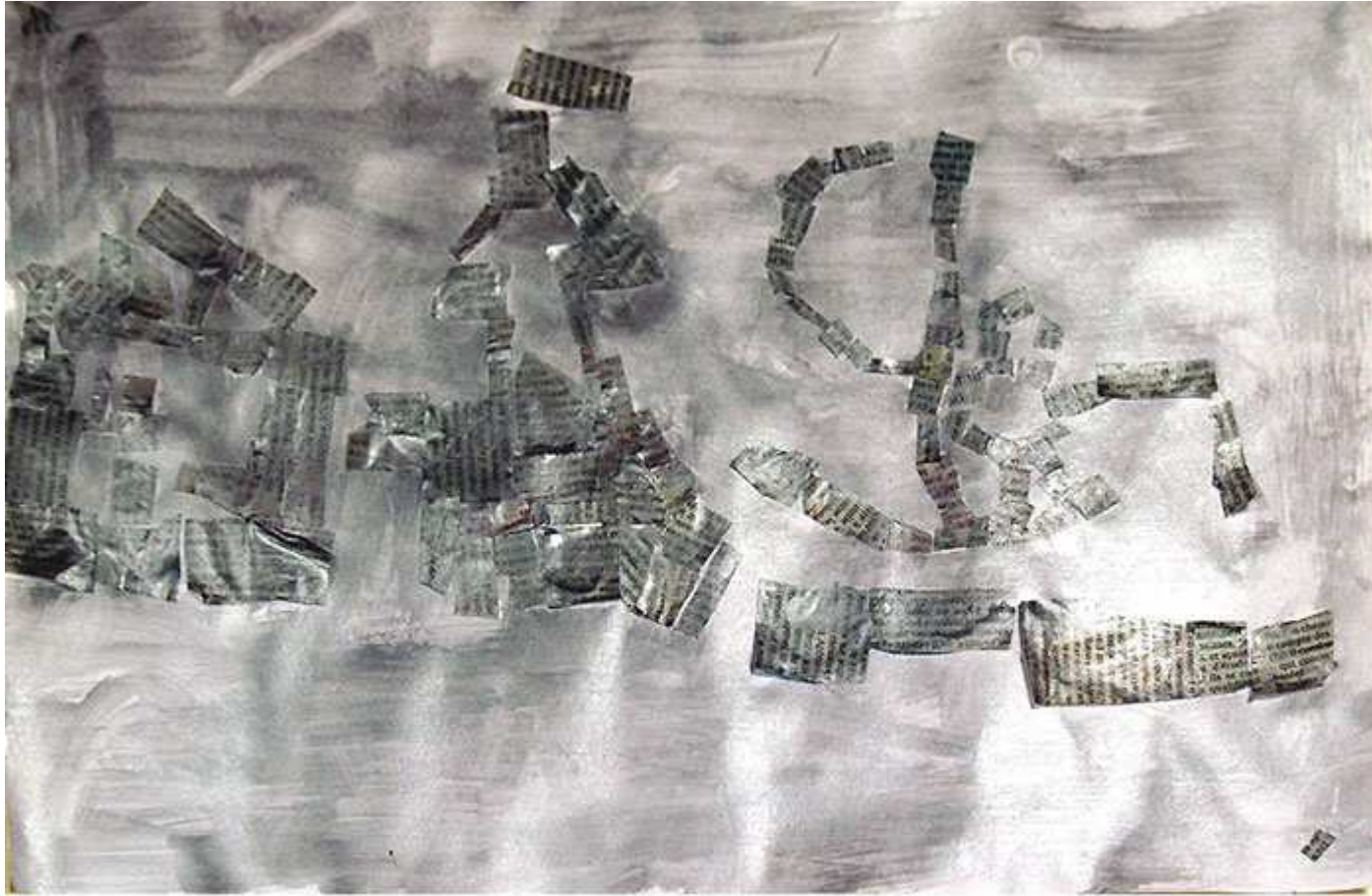
La maison du magicien, le château et le magicien sur son bateau (Lucas)