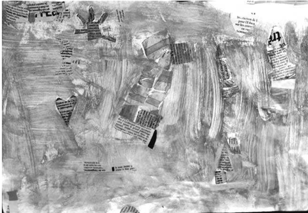
Le ciel avec des nuages et un train qui passe près des maisons. (Prescillia)