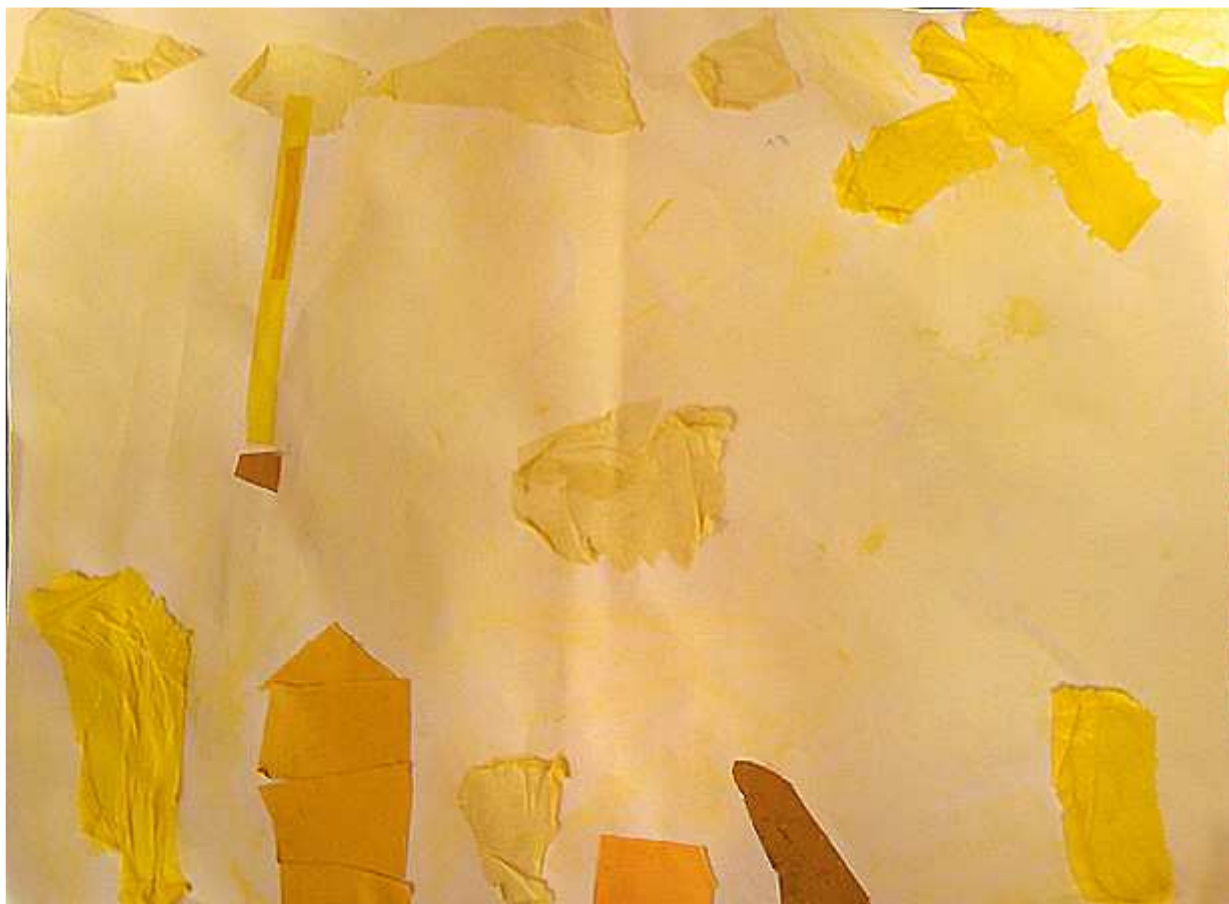
Il y a une pierre qui tombe du ciel, un nuage qui pleure et la maison du magicien entourée de collines jaunes. (Romain)