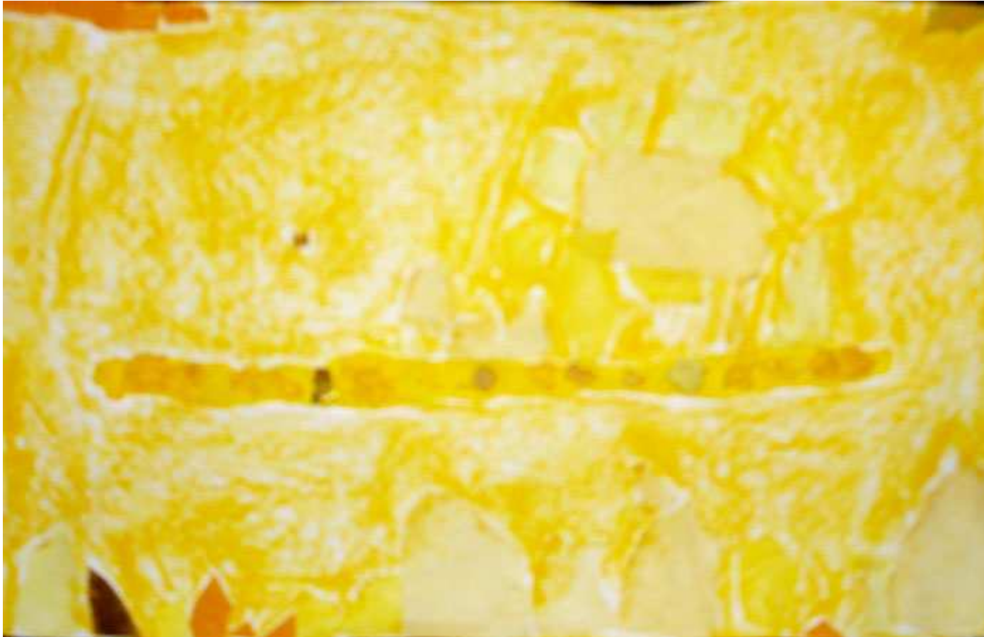
Plein de maisons jaunes, derrière il y a la maison du magicien avec une bande de fleurs jaunes devant. (Roxane)