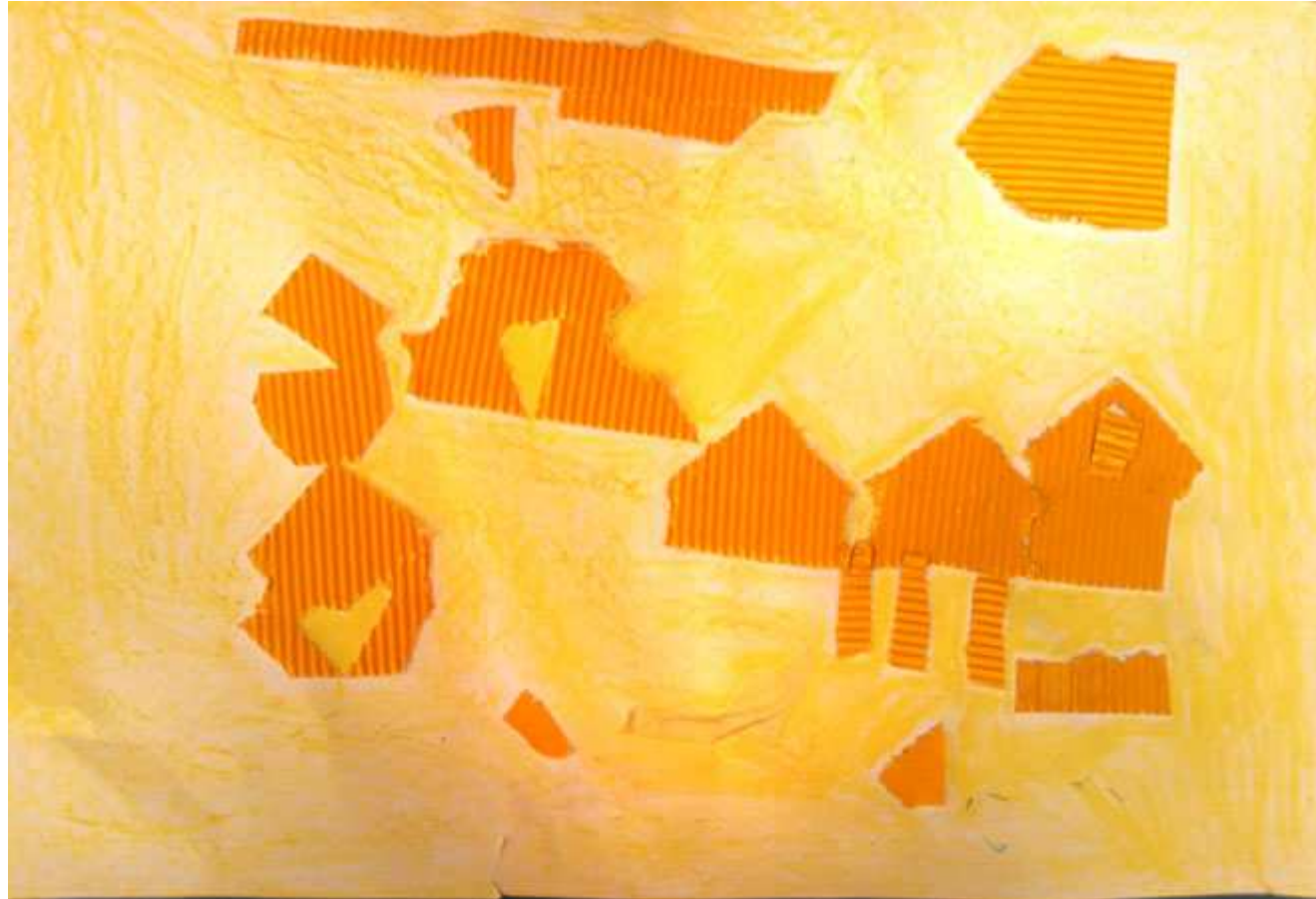
Trois maisons jaunes avec des fenêtres et des garages, un tunnel jaune et dans le ciel jaune, vole un avion à réaction (Eliott)