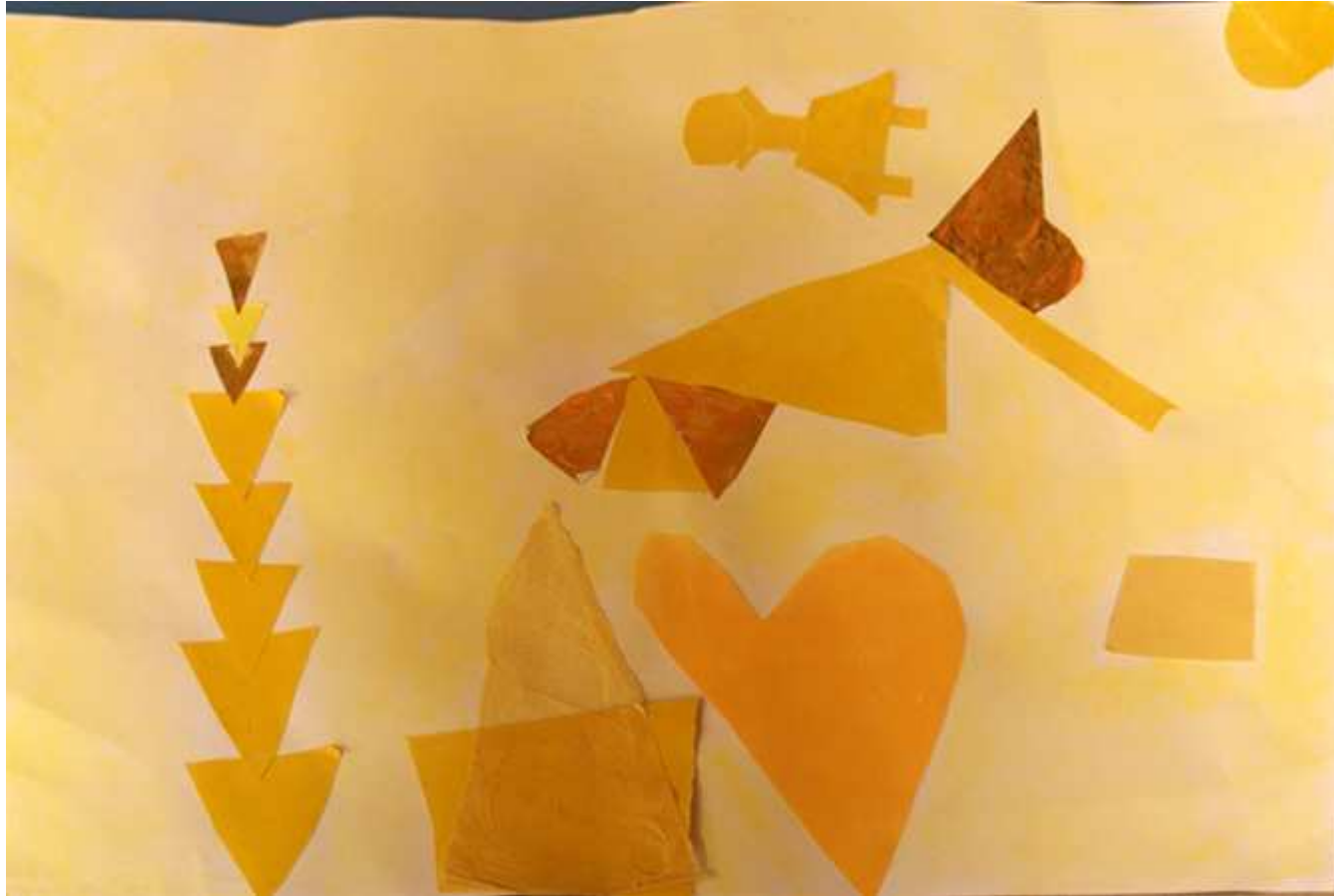
Une petite fille dort dans son lit au soleil près de la pyramide jaune. (Lucie)