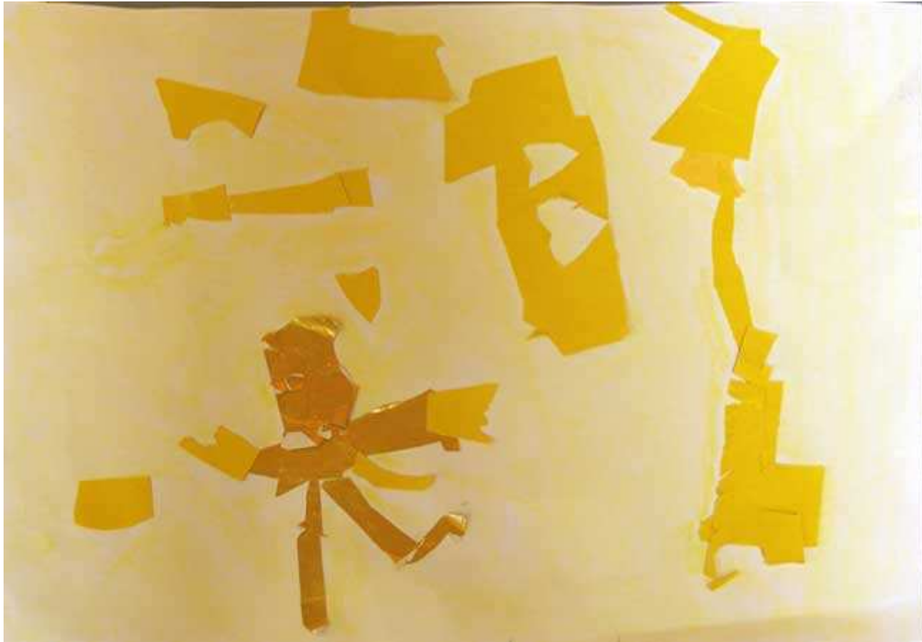
Une petite fille qui a retrouvé sa petite boule jaune qui brille. (Elodie)