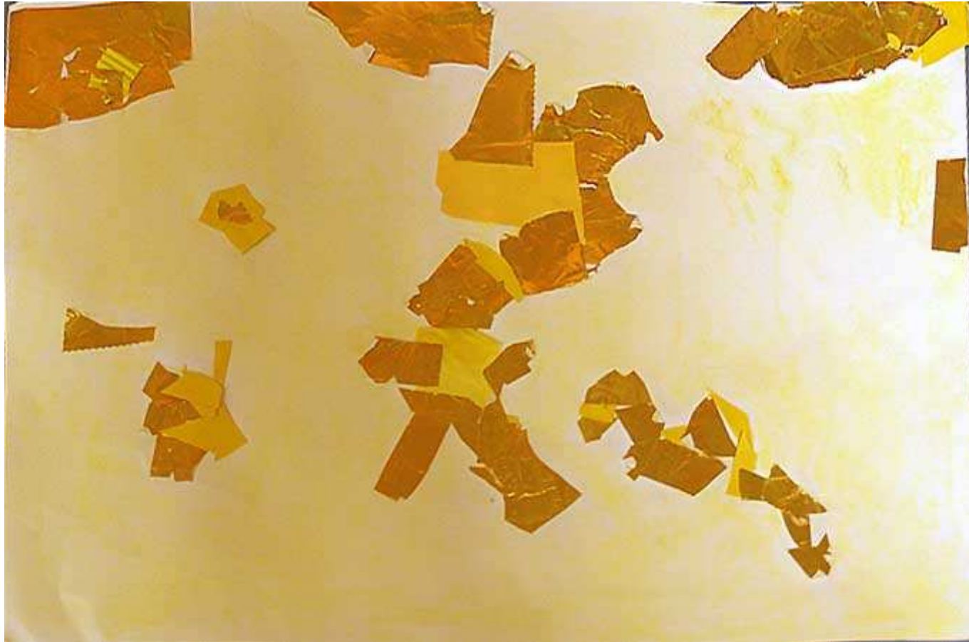
Une femme qui a peur du serpent jaune et l'aigle jaune qui va la sauver. (Elodie)