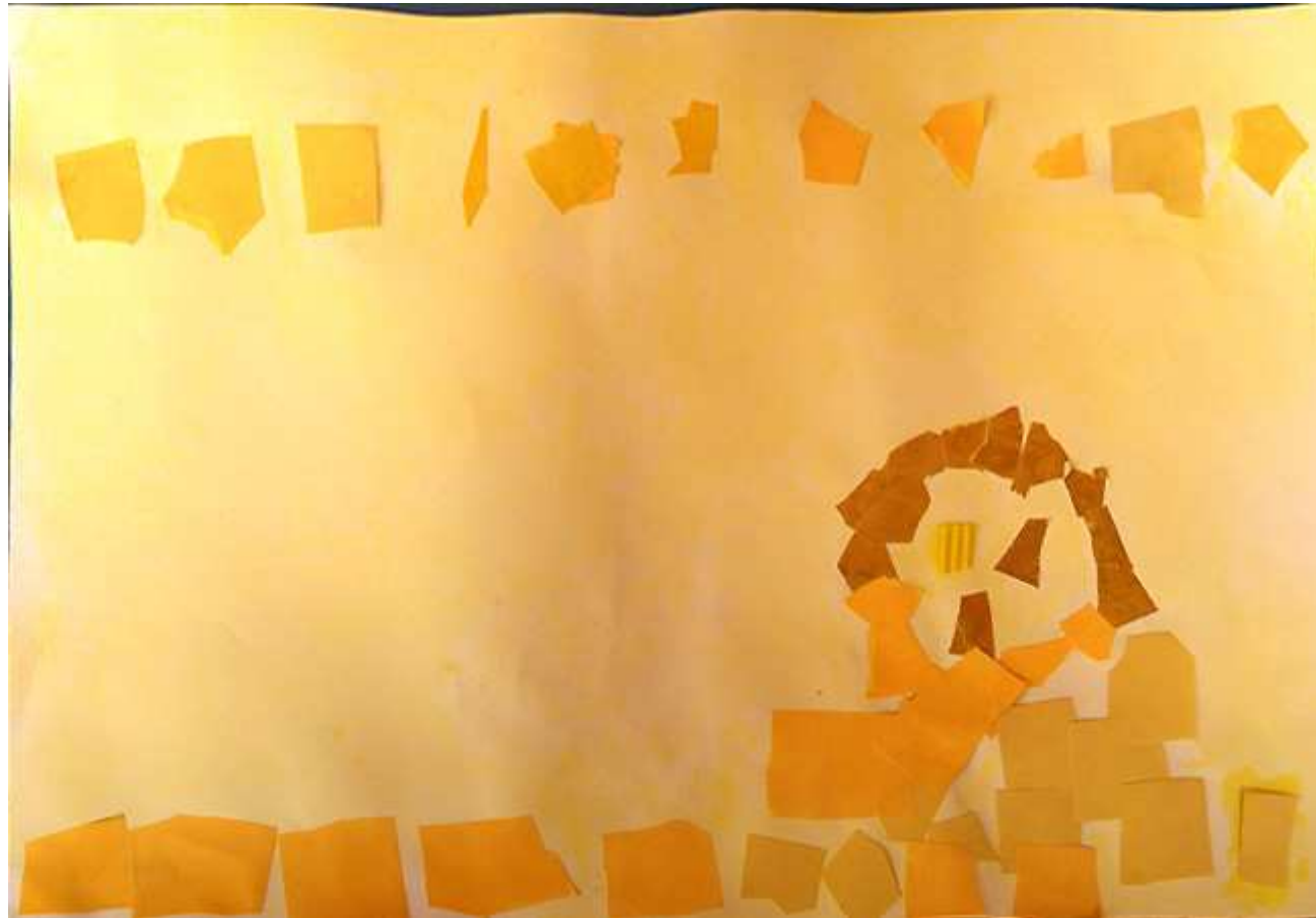
Une petite fille qui se promène dans le jardin jaune. (Anouk)