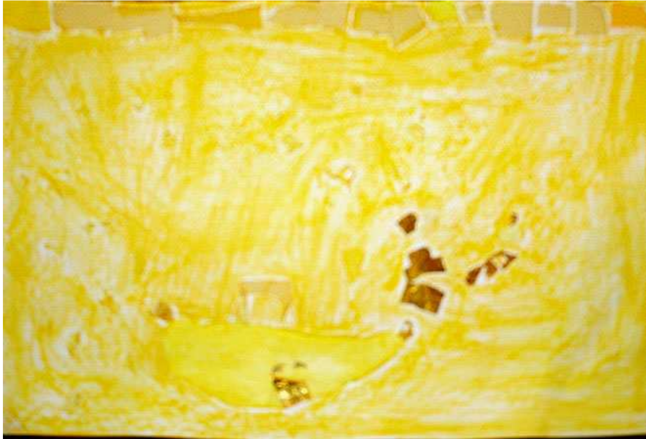
Le pont jaune sur la rivière jaune, des cailloux jaunes dorés dans l'eau. (Aucéane)