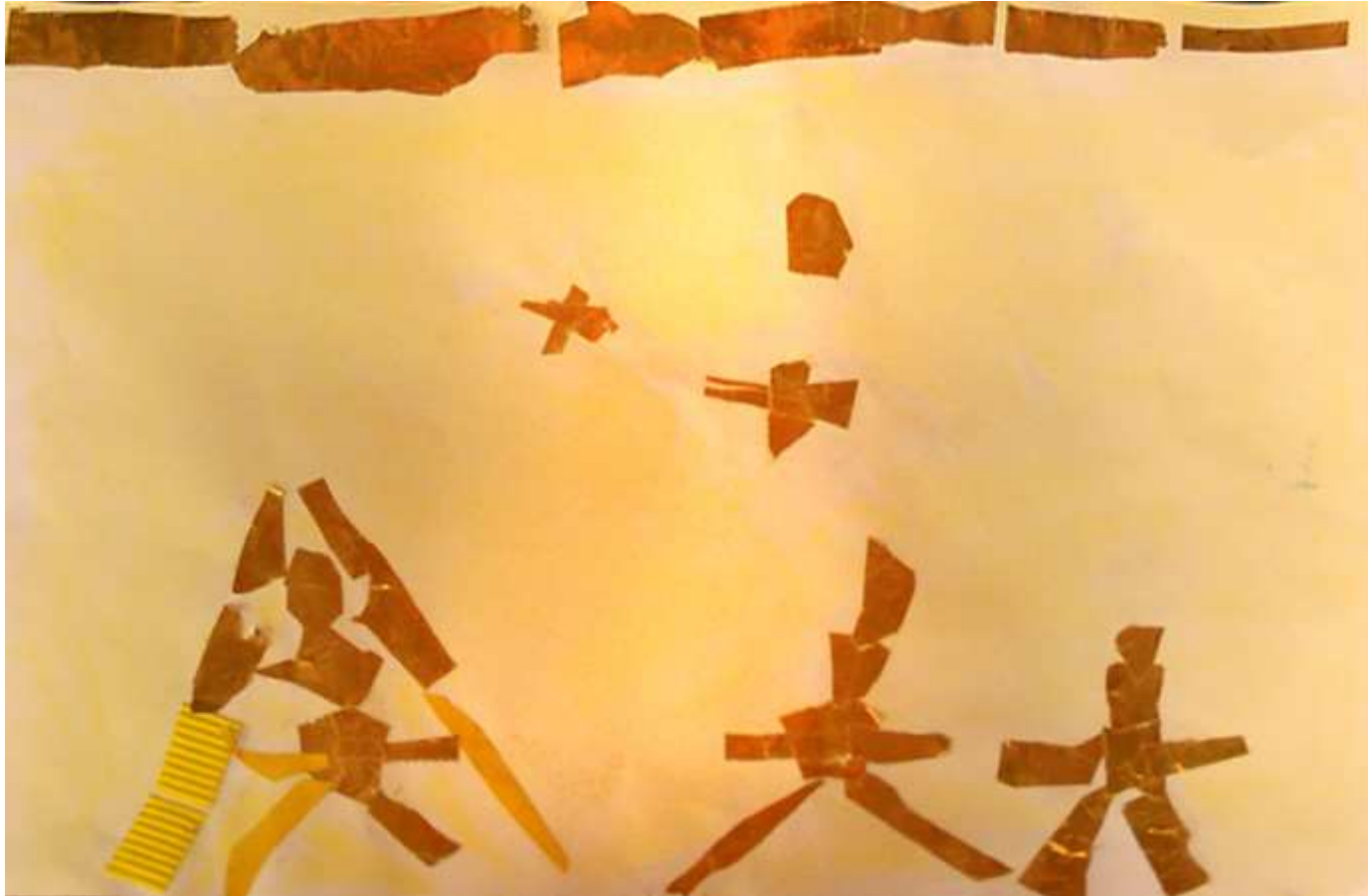
Un indien a trouvé un trésor et des hommes méchants veulent le récupérer. (Mateo)