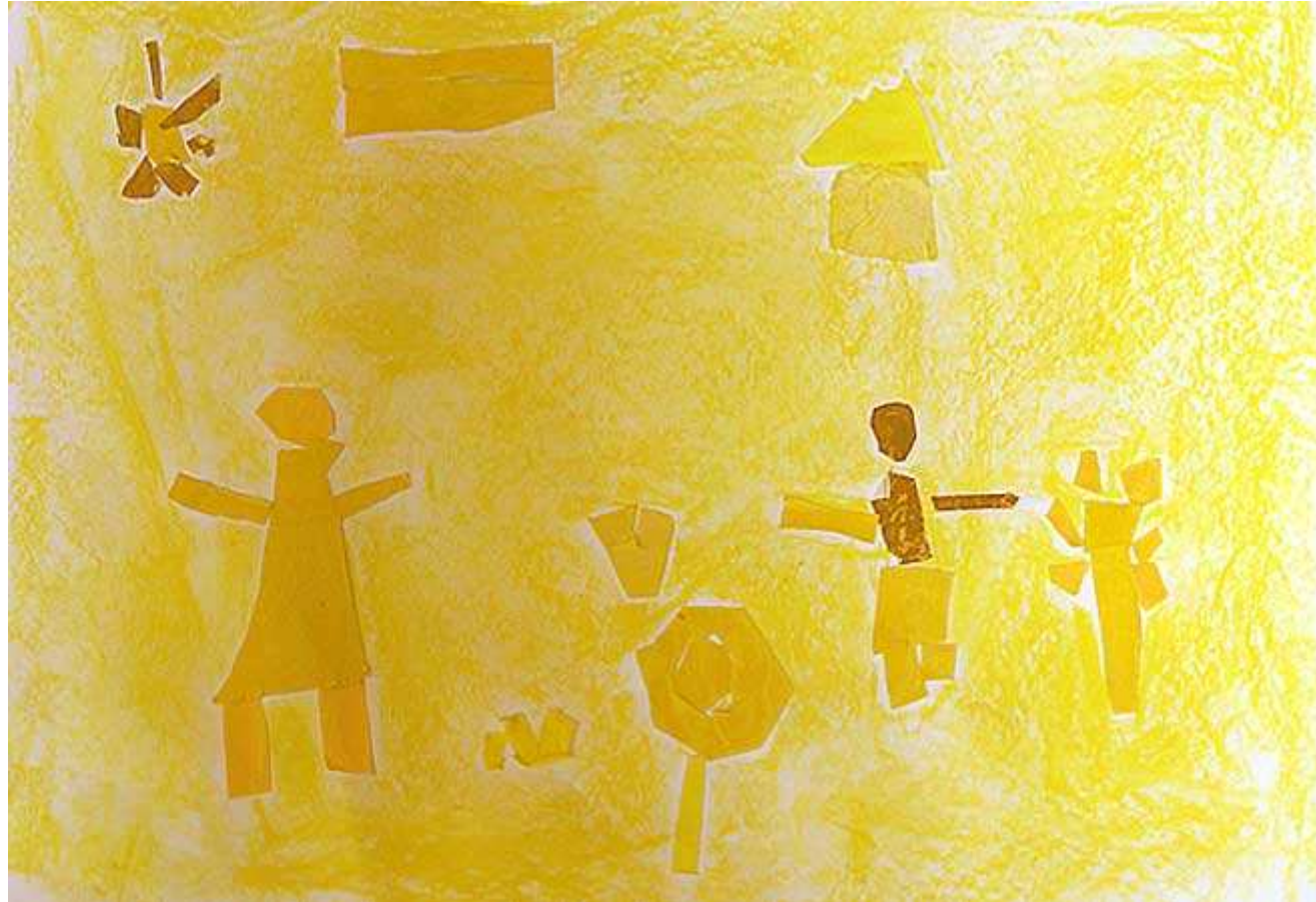
Une femme se promène, elle rencontre un serpent jaune près de la fleur jaune puis un homme qui cueille des pommes jaunes. (Lucile)