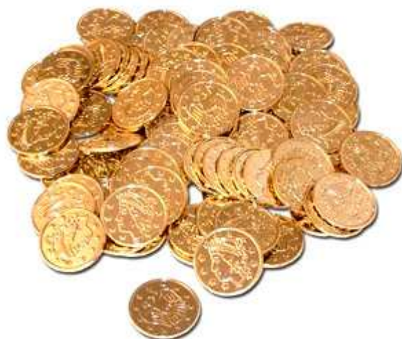
des pièces d'or