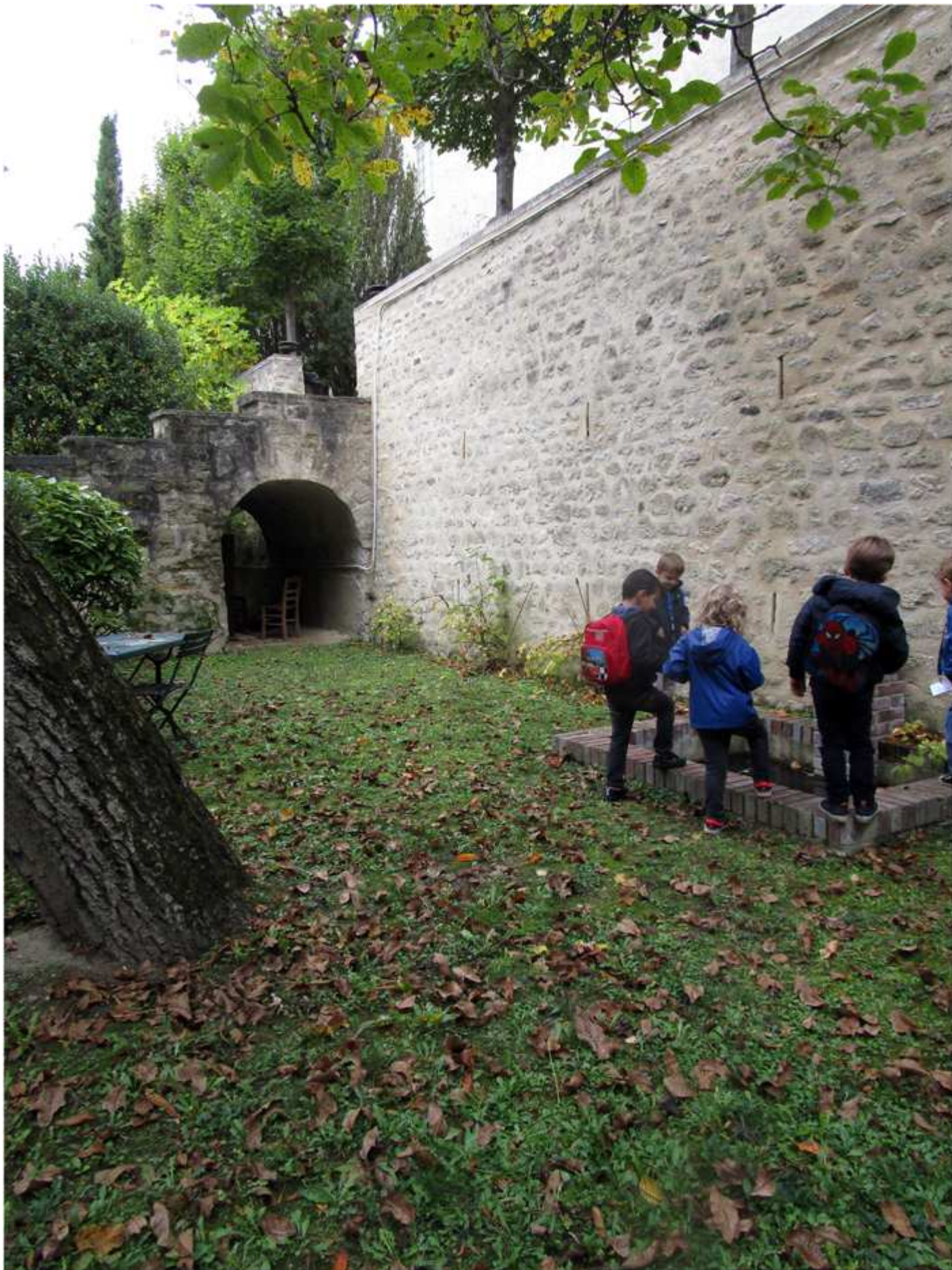
la partie du jardin peinte sur le tableau