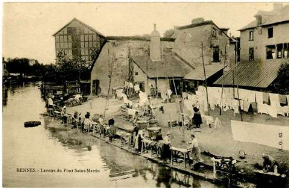
RENNES - Lavoirs du Pont Saint-Martin