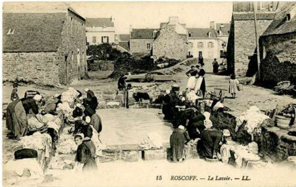
15 ROSCOFF. — Le Lavoir. — LL.