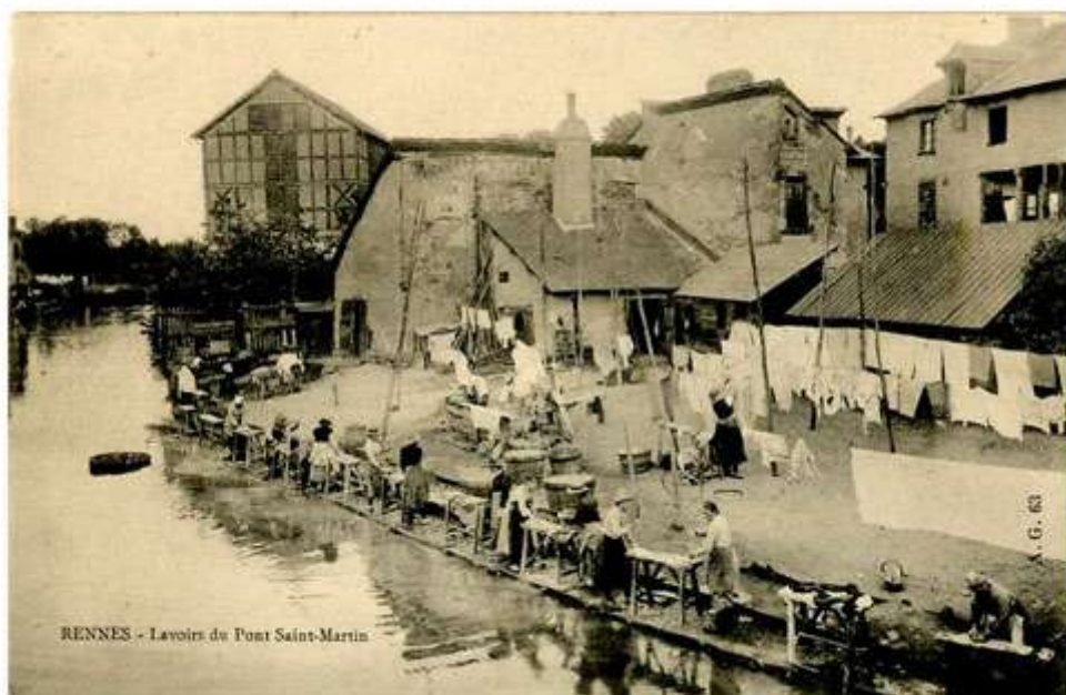
RENNES - Lavoirs du Pont Saint-Martin