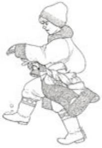
NICKI Nicki Nicki