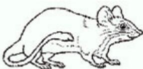
LA SOURIS la souris la souris