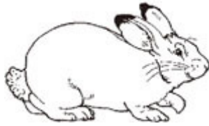
LE LIEVRE le lièvre le lièvre