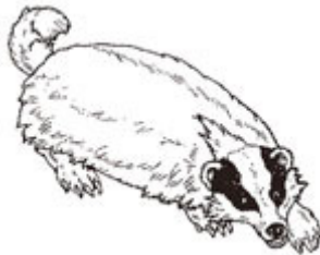
LE BLAIREAU le blaireau le blaireau