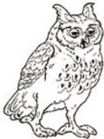
LE GRAND HIBOU le grand hibou le grand hibou