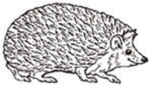
LE HERISSON le hérisson le hérisson