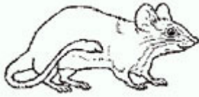
LA TAUPE la taupe la taupe