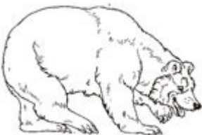
L'OURS BRUN l'ours brun l'ours brun