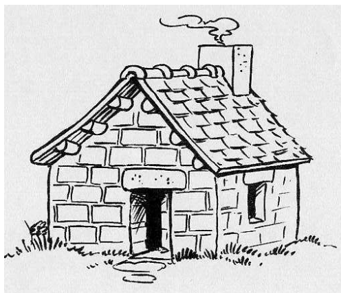
La maison en briques