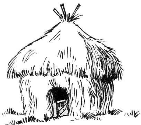
La maison en paille

Consigne : colle les maisons à leur place.