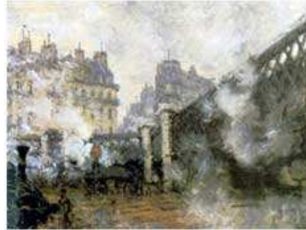
"Pont de l'Europe, Gare Saint-Lazare"