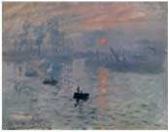
"Impressions soleil levant"