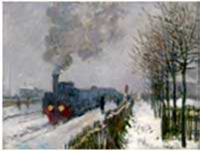
"Le train dans la neige, la locomotive"