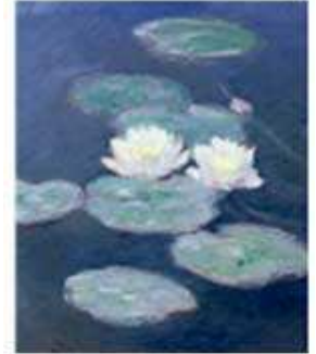
"Nymphéas, effet du soir"