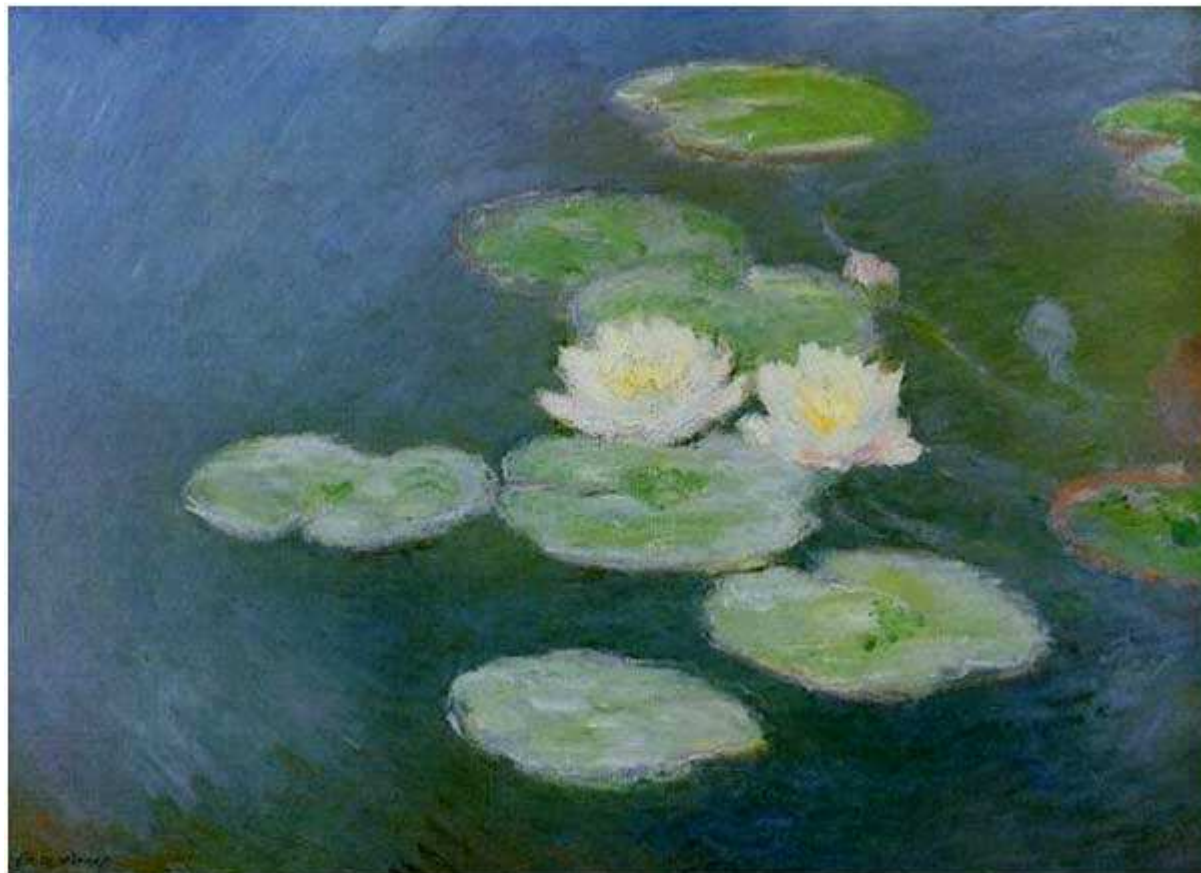
"Nymphéas effet du soir" (1897)

Dessins des élèves de la classe lors de la "visite atelier" du 7 mai à partir de l'œuvre de Claude Monet