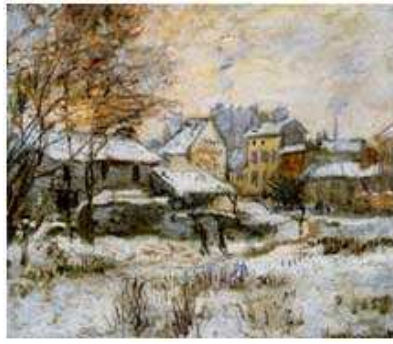
"Effet de neige, soleil couchant"