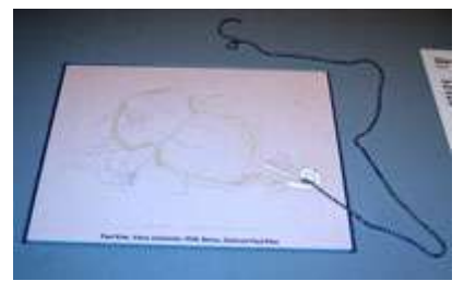
tableau "jouet" en déplaçant la lumière.

Nous avons repris le car pour retrouver les correspondants dans leur école après avoir pique-niqué assis à côté de nos correspondants nous avons joué dans la cour et enfin nous avons chanté des chansons et dit des poésies..