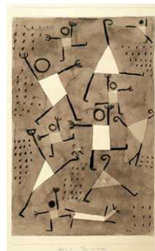
Dances sous l'emprise de la peur