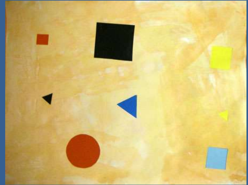
Étape 2 : coller des formes géométriques en papier couleur