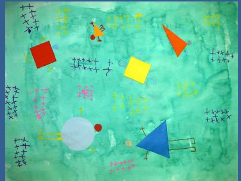
Étape 4 : dessiner des graphismes en paquets