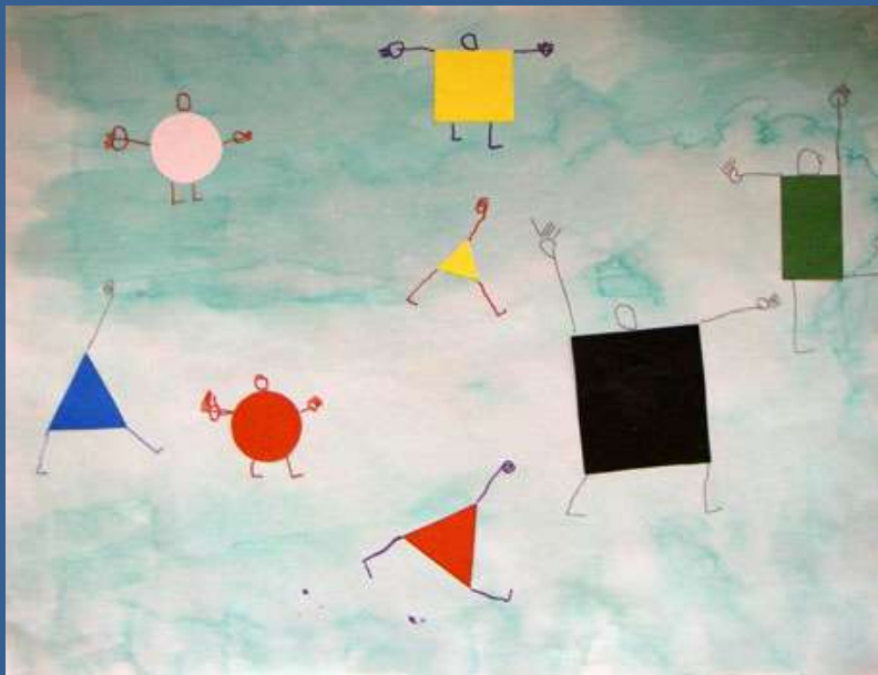
Étape 3 : tracer des membres et des têtes aux feutres "Posca"