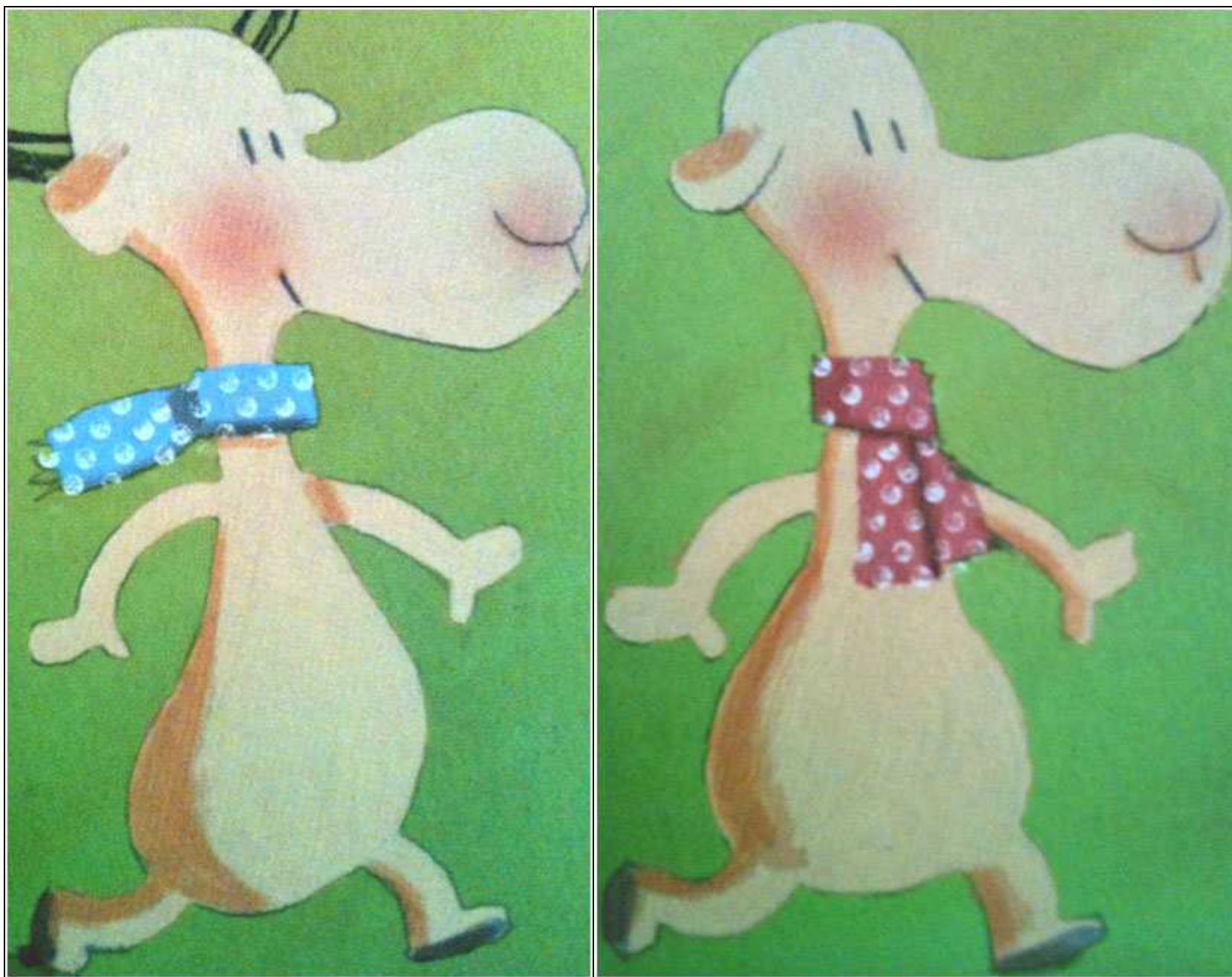
modèles à imprimer sur papier Canson format A3