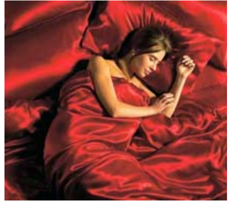
DRAP EN SATIN