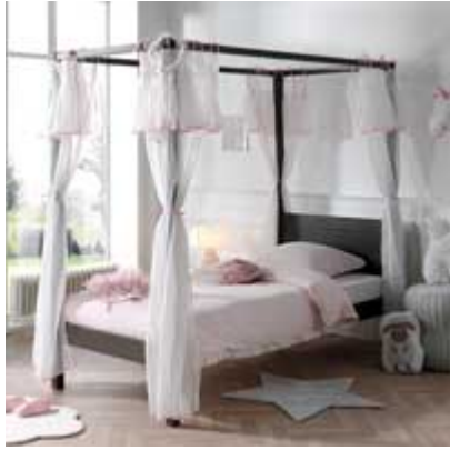
LIT À BALDAQUIN