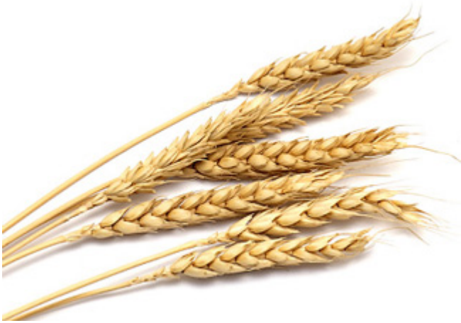
ÉPIS DE BLÉ