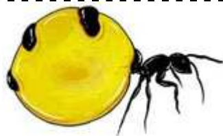
FOURMI À MIEL